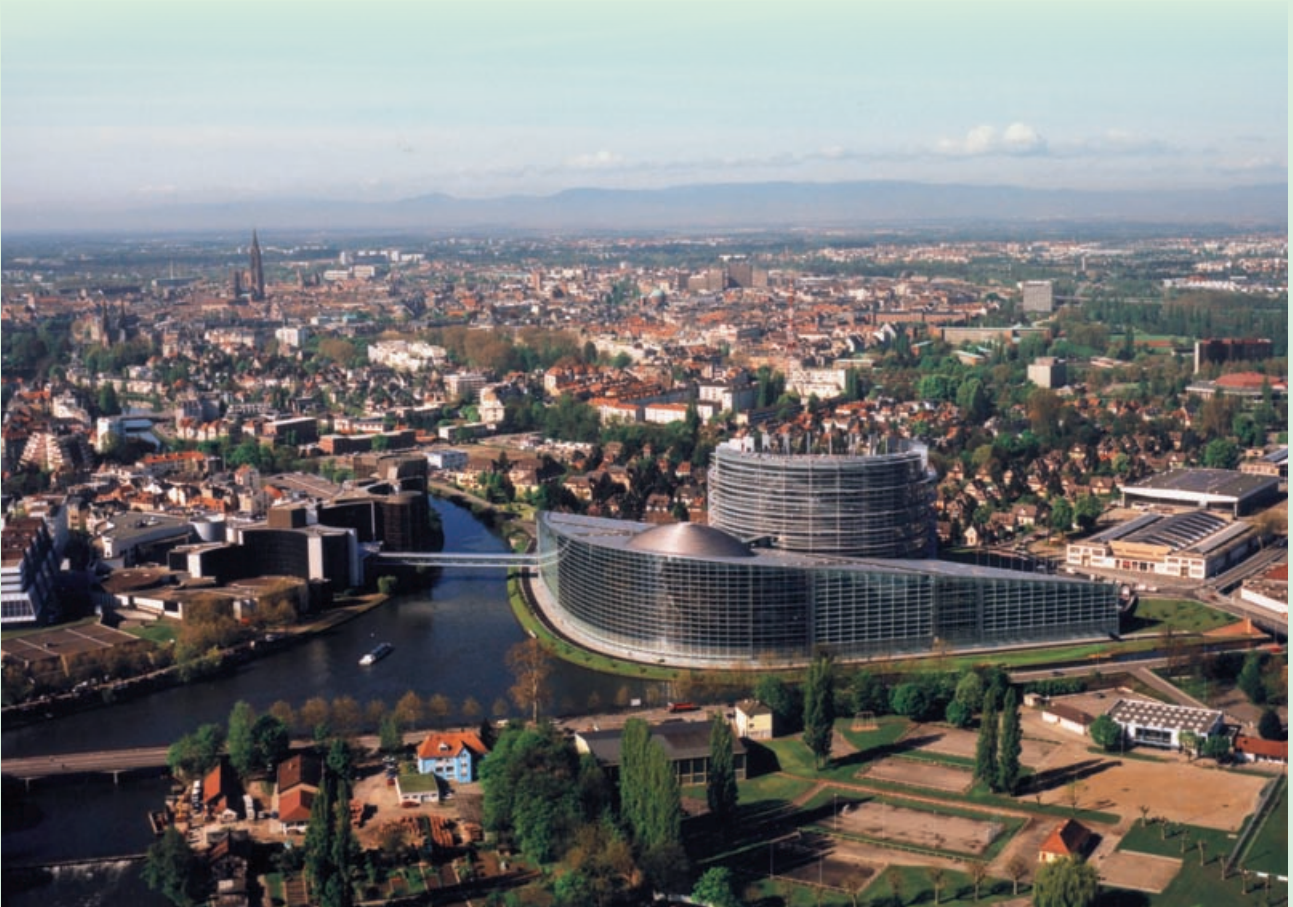
Strasbourg, Parlement Européen / Europaparlament, Straßburg (F).