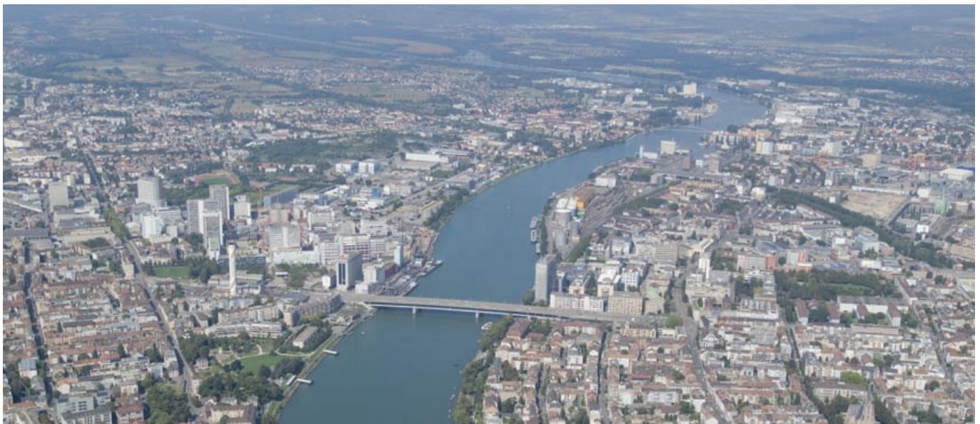
L'agglomération Bâloise / Agglomeration Basel (CH-D-F).

Auf der Karte ist die Abgrenzung des künftigen SCoT dargestellt. Gemeinden, die nicht vom bisherigen Schéma Directeur abgedeckt wurden, sind in diesem Teilraum weiß dargestellt.