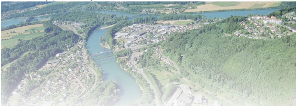
Koblenz - Waldshut-Tiengen (CH-D).

Informationen über SCoT-Gebiete sowie allgemein über französische administrative Raumeinheiten stehen unter http://www.territoires.gouv.fr/indicateurs/portail_de/index_de.php zur Verfügung