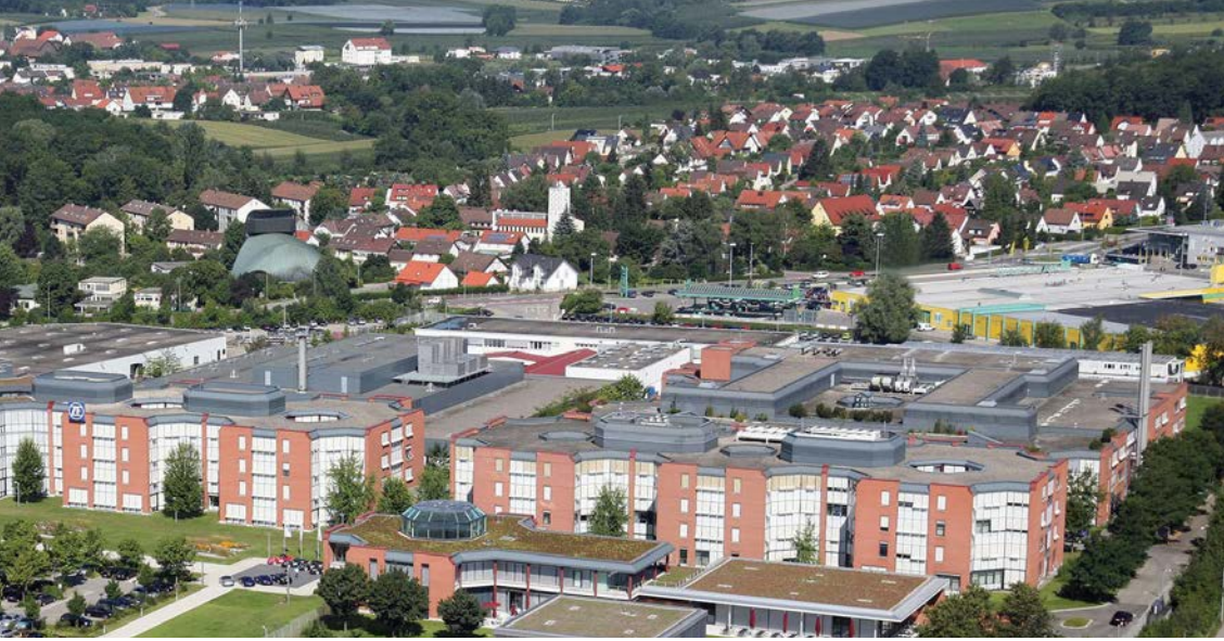
Am Konzernsitz der ZF Friedrichshafen AG ist auch ein Forschungs- und Entwicklungszentrum angesiedelt. Die Zentrale Forschung und Entwicklung unterstützt die operativen Entwicklungsbereiche in den Themengebieten der Antriebs- und Fahrwerktechnik sowie der aktiven und passiven Sicherheitstechnik.

Für den wirtschaftlichen Austausch sind ein freier Zugang zu Märkten und Fachkräften sowie hinsichtlich der EU-Binnenmarktregelungen ein möglichst homogener Rechtsrahmen wichtige Rahmenbedingungen. Es besteht ein strategisches Interesse der Wirtschaft auf beiden Seiten, dass Hürden und Handelshemmnisse weiter abgebaut werden, dass die Schweiz die Binnenmarktregelungen der EU möglichst komplett anwendet und dass sie einheitlich ausgelegt werden und gleichwertige Rechtsweggarantien bestehen.