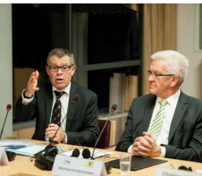
Regierungsrat Ernst Stocker und Ministerpräsident Winfried Kretschmann