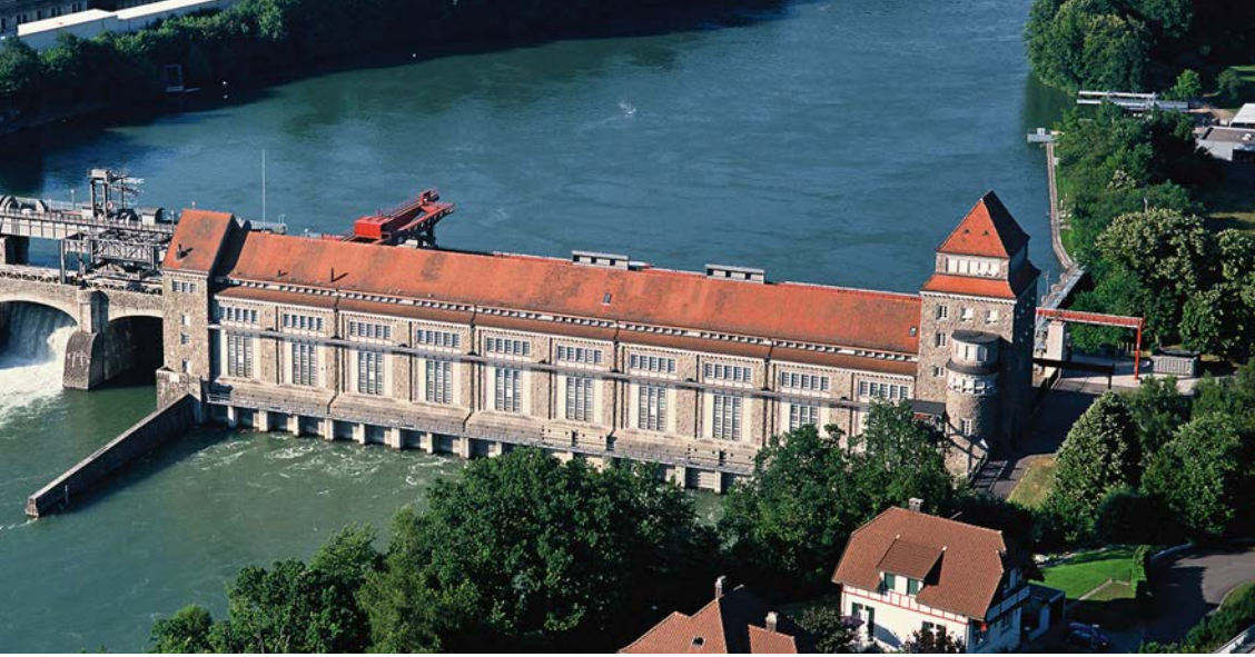
Luftbild Kraftwerk Laufenburg (Rheinkraftwerke werden am Hoch- rhein gemeinsam betrieben)

Baden-Württemberg ist von der Suche nach einem Atomendlager in der Schweiz unmittelbar betroffen. Das strukturierte Vorgehen mit einer umfangreichen Beteiligung der Bevölkerung könnte auch ein geeigneter Ansatz für die Endlagerung in Deutschland sein. Ein enger Informationsaustausch und eine angemessene Beteiligung der grenznahen deutschen Gemeinden dazu wird weiterhin angestrebt.