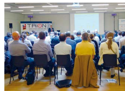
Trinationales Unternehmertreffen von TRION-climate e.V. Mai 2017 in Weil am Rhein