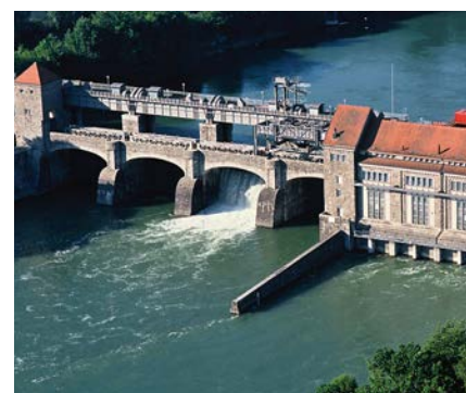
Energie: Detail Luftbild Kraftwerk Laufenburg, Rheinkraftwerke werden am Hochrhein gemeinsam betrieben