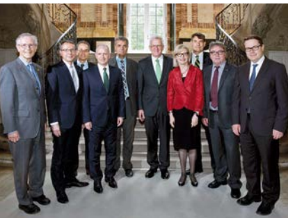
Ministerpräsident Winfried Kretschmann (Mitte) mit den Vertretern der Schweizer Grenzkantone

Der Schweizer Bundesrat hat in der Folge Gespräche mit der EU-Kommission aufgenommen, denn Höchstzahlen und Kontingente sind nicht vereinbar mit der zwischen der Schweiz und der EU vereinbarten Personenfreizügigkeit. Im Dezember 2016 wurde in der Schweiz ein Umsetzungsgesetz beschlossen, das die Verpflichtungen aus dem Freizügigkeitsabkommen einhalten soll. Es sieht keine Obergrenze und Kontingente für die Zuwanderung vor, sondern eine Vorzugsbehandlung für Stellensuchende, die bei der Arbeitsvermittlung gemeldet sind. Dazu zählen auch EU-Ausländer,