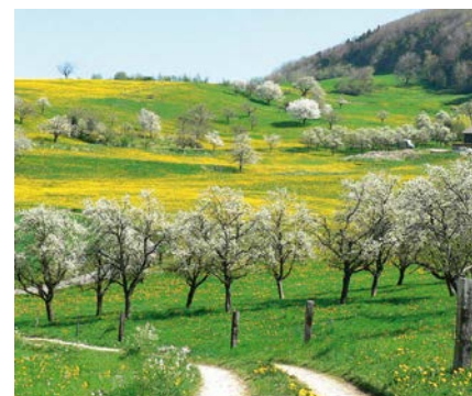
Natur und Umwelt: Kirschenblust in Oltingen