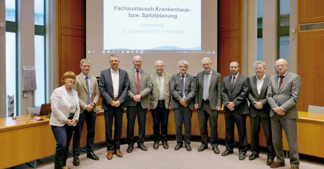
Kommission Gesundheit und Soziales der IBK beim Fach Austausch Krankenhausplanung im September 2017.

Die Patientenmobilität ist bei der grenzüberschreitenden Gesundheitsversorgung von besonderer Bedeutung. Hier gilt es, die Schranken weiter abzubauen, wie das Pilotprojekt Basel/Lörrach zeigt. Bürokratische Hürden abzubauen und wohnortnahe Behandlungsangebote zu ermöglichen, ist das Ziel dieses Projektes. Die beabsichtigte Lockerung des Territorialprinzips im Schweizerischen Krankenversicherungsrecht würde dieses Modell verstetigen und den gesamten Grenzraum für mehr Patientenmobilität öffnen. Ob eine Übernahme der EU-Patientenrichtlinie durch die Schweiz gelingt, wird auf politischer Ebene zu entscheiden sein.