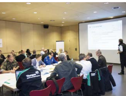
Arbeitsgruppe 1 „Führung- (Stäbe) und Problemdeckung“ während der binationalen Fachkonferenz vom 19.01.2017 in Kreuzlingen (CH)

Auch im Bereich des Bevölkerungsschutzes ist die Kooperation traditionell sehr gut und soll weiter ausgebaut werden, insbesondere durch eine Anpassung der Instrumente des Katastrophenschutzes. Regelmäßig werden etwa im Rahmen der Oberheinkonferenz länderübergreifende gemeinsame Übungen durchgeführt.