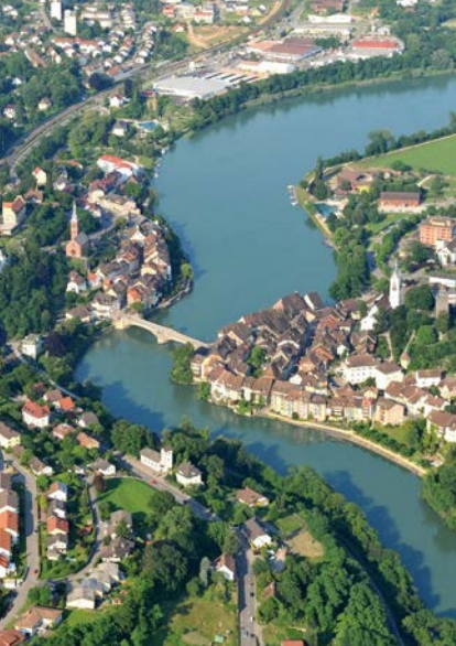
Der Rhein bei Laufenburg