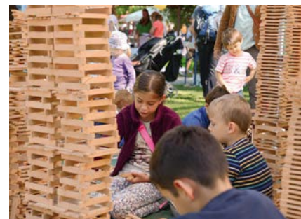
Kinderfest: Jedes Jahr am Ende der Sommerferien verwandelt sich der Konstanzer Stadtgarten in die „größte Spielwiese am Bodensee“. Rund 70 Institutionen und Vereine bieten verschiedene Mitmachaktionen und Spiele für kleine und große Kinder an.