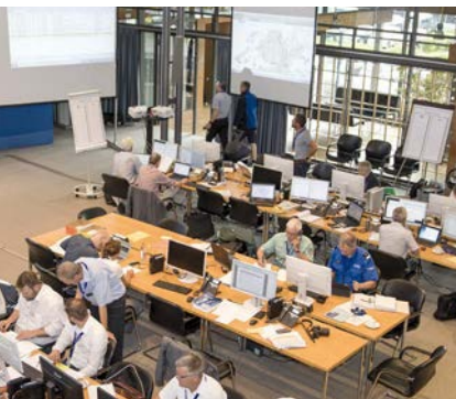
Binationale Übungsleitung/Regie mit allen beteiligten Schweizer und Deutschen Behörden am Übungstag 26.06.2017 in den Räumlichkeiten des Landratsamt Schwarzwald-Baar-Kreis in Villingen (D)

Die informelle und operative Zusammenarbeit zwischen der Polizei Baden-Württemberg und den schweizerischen Polizeidiensten ist ausgesprochen eng, reibungslos und effizient. Auf allen Ebenen haben sich vielschichtige Kooperationsformen herausgebildet. Sie sind notwendige Voraussetzung für eine rasche und unbürokratische Bewältigung von polizeilichen Ad hoc-Einsätzen und für den Aufbau funktionierender Informations- und Kommunikationsstrukturen. Nach der Assoziierung an Schengen hat die Schweiz ein Verhandlungsmandat für den Beitritt zum Prümer Vertrag über die Vertiefung der grenzüberschreitenden Zusammenarbeit verabschiedet. Damit ist eine noch engere und intensivere polizeiliche Zusammenarbeit zu erwarten.