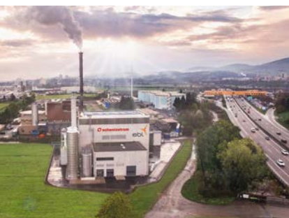
Neues Holzkraftwerk der EBL (Genossenschaft Elektra Baselland) in Pratteln

Ein besonderes Potential besteht in einem Ausbau der Zusammenarbeit in den Bereichen Energie und Klimaschutz. Mit dem deutschen Atomausstieg und der Schweizer „Energierategie 2050“ sowie der drängenden Notwendigkeit, den Klimawandel zumindest zu begrenzen und sich an ihn anzupassen, sind erhebliche Veränderungen und Anpassungen erforderlich. Deutschland und die Schweiz können sich dabei ergänzen, denn der Schweiz könnte im Kontext einer europaweiten Energiewende neben der Bedeutung als Transitland auch eine Rolle als Energiespeicher zukommen.