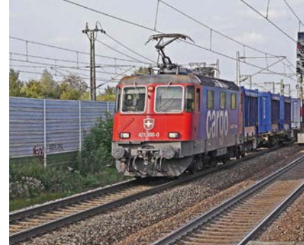
Mobilität: Güterzug auf der Oberrheinstrecke

Eine gemeinsame Beteiligung besteht auch an dem INTERREG-B-Programm Nordwesteuropa, aus dem u. a. die Projekte Rheinradweg und Corridor 24 „Rotterdam – Genua“ gefördert werden.