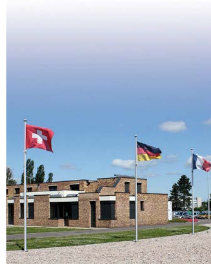
Die INFOBEST PALMRain ist die einzige trinationale INFOBEST und die einzige, die Fragen zur Schweiz beantworten kann. Sie befindet sich in einem ehemaligen französischen Zollgebäude im Dreiländereck von Frankreich, Deutschland und der Schweiz.

Nach dem Abschluss eines Freihandelsabkommens (Abbau von Zöllen) zwischen der Schweiz und der EU im Jahr 1972 stellte sich mit dem europäischen Binnenmarkt (diskriminierungsfreier Marktzugang) zunehmend die Frage ihrer Beteiligung. 1992 hat die Schweizer Regierung ein Gesuch zur Aufnahme von Beitrittsverhandlungen bei der