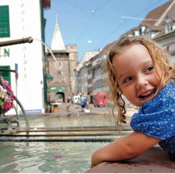
Brunnen in Basel