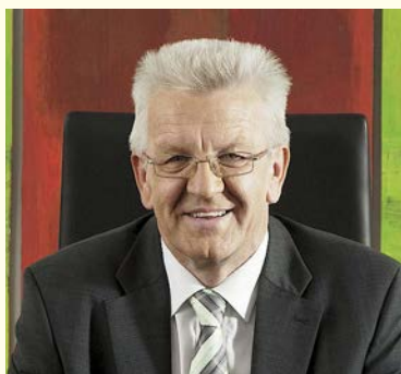
Winfried Kretschmann MdB

Baden-Württemberg und die Schweiz liegen im Herzen Europas und sind international sehr stark verflochten. In diesem Umfeld kommt der Zusammenarbeit über Grenzen hinweg eine noch größere Bedeutung zu. Die mit der sogenannten „Masseneinwanderungsinitiative“ angestoßene Debatte um die Zukunft des bilateralen Weges zwischen der EU und der Schweiz spielt hier eine wichtige Rolle. Mit den im Folgenden vorgelegten strategischen Eckpunkten soll der Blick in die Zukunft gerichtet werden, um gemeinsam mehr zu erreichen und einen Beitrag zu Wohlstand und Stabilität in Europa zu leisten.