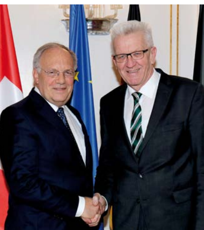
Ministerpräsident Winfried Kretschmann (rechts) und der Schweizer Bundesrat Johann Schneider-Ammann (links)