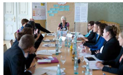
Diskussionen in den Workshop-Gruppen bei der Demokratiekonferenz 2015 in Stuttgart