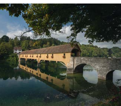
Rebland und Naturimpressionen aus dem Naturpark Schaffhausen