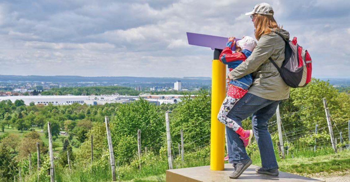
Das Projekt «24 Stops» verknüpft über eine Länge von fünf Kilometern zwei Länder, zwei Gemeinden, zwei Kulturinstitutionen mit 24 Wegmarken des Künstlers Tobias Rehberger.

Projektträger: Gemeinde Riehen (CH), Stadt Weil am Rhein (D), Fondation Beyeler (CH), Vitra (D)