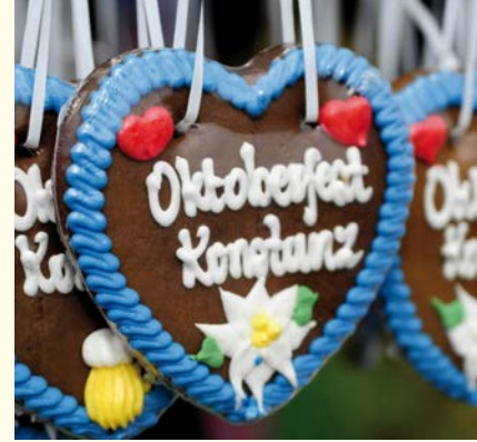
Oktoberfest: Seit 16 Jahren gehört das Deutsch-Schweizer Oktoberfest zum Konstanzer Veranstaltungskalender und zieht jährlich weit mehr als 100.000 Besucher an.

nach Art. 23 des Freizügigkeitsabkommens. Künftige Beschränkungen und der Aufbau neuer bürokratischer Hürden würden aber die bisherigen Bemühungen, diese weiter abzubauen, konterkarieren. Deshalb setzt sich die Landesregierung dafür ein, dass die bestehenden Arbeitsmöglichkeiten für Grenzgängerinnen und Grenzgänger erhalten bleiben.