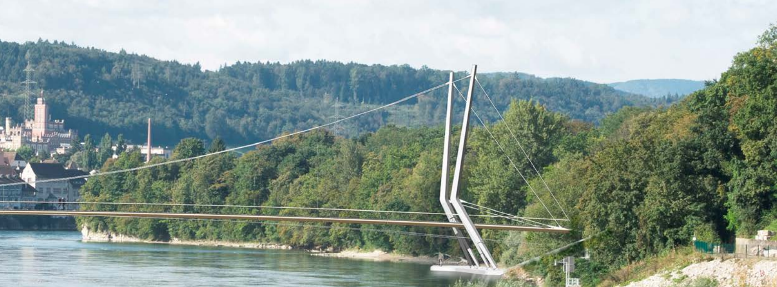
Visualisierung Neuer Rheinsteg Rheinfelden (Bild oben und Titelbild) (Interreg-Projekt, wird die beiden Rheinfeldern verbinden) Entwurfsverfasser: Ingenieurbüro Miebach, Lohmar (Ingenieur); Swillus Architekten, Berlin (Architekt); HHVH Landschaftsarchitekten, Berlin (Landschaftsarchitekten); Interreg A-Projekt Alpenrhein-Bodensee-Hochrhein

sive Diskussion über die Zukunft des bilateralen Weges angestoßen, der eine wichtige Basis der grenzüberschreitenden Zusammenarbeit darstellt.