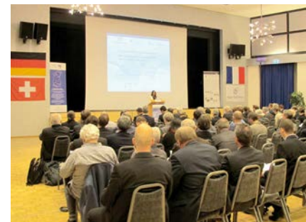
1. Trinationaler Energiekongress von TRION-climate e.V. November 2015 in Liestal, Baselland

der gegenseitigen Information und Anhörung bezüglich aller Vorhaben, die grenzüberschreitende Umweltauswirkungen haben können. Grundlage für diese einvernehmliche und vertrauensbildende Behördenpraxis ist mittlerweile der Leitfaden zur grenzüberschreitenden Beteiligung bei umweltrelevanten Vorhaben sowie Plänen und Programmen der Oberrheinkonferenz vom 10.12.2010. Diese Verfahren könnten durch entsprechende Vereinbarungen auf die übrigen Grenzkantone ausgedehnt werden.