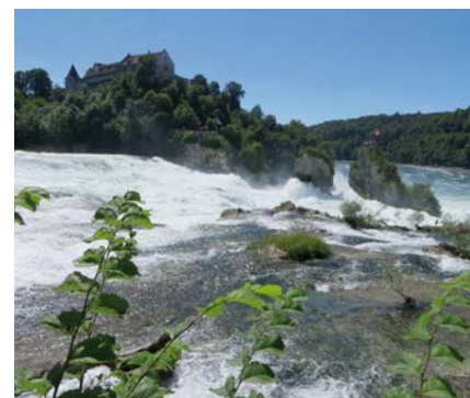
Tourismus: Rheinfall bei Schaffhausen