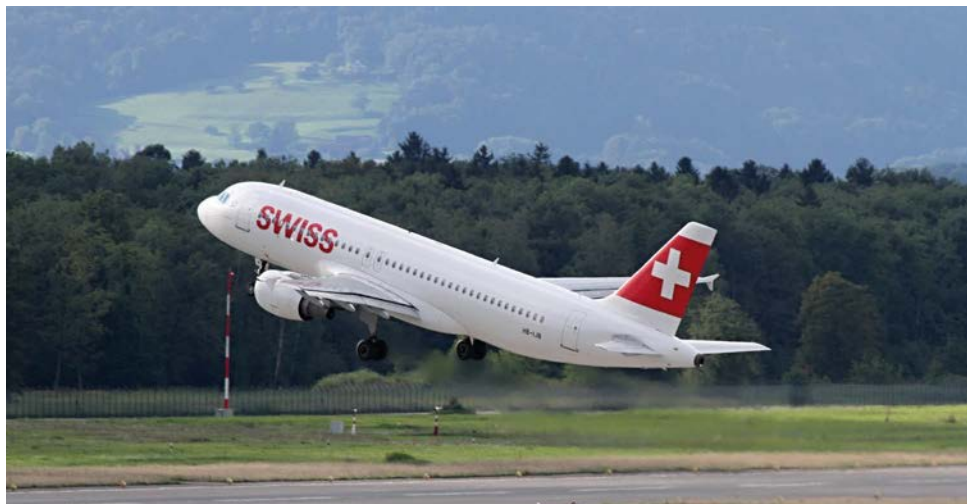
links oben: Autobahn bei Zürich, rechts oben: Bahnhof SBB Basel rechts Mitte: Schifffahrt auf dem Bodensee rechts unten: Flughafen Zürich

Ein wichtiges Thema für die Grenzregion ist der Fluglärm, der vom Flughafen Zürich ausgeht. Im langjährigen Streit setzt sich das Land auf der Grundlage der „Stuttgarter Erklärung“ beim für die An- und Abflüge über deutsches Gebiet zuständigen Bund und im Austausch mit den Schweizer Ansprechpartnern für eine einvernehmliche und nachhaltige Lösung ein, die den Belangen der Bevölkerung gerecht wird. Tragfähige Lösungen müssen die Menschen in der Region einbinden und im Ergebnis Verbesserungen bei der Lärmbelastung in Südbaden und eine Reduzierung der Flugbewegungen über deutschem Gebiet durch eine gerechtere Verteilung bringen. Der vorliegende Staatsvertrag kann deshalb nach Ansicht der Landesregierung in der vorliegenden Fassung vom Bund nicht ratifiziert und das vorgelegte Ostanflugskonzept des Flughafens Zürich vom Bundesaufsichtsamt für Flugsicherung nicht genehmigt werden.