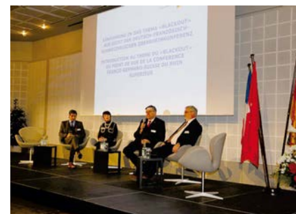
Podiumsdiskussion Veranstaltung „Blackout“ der DE-FR-CH Oberrheinkonferenz in Basel, Dezember 2016