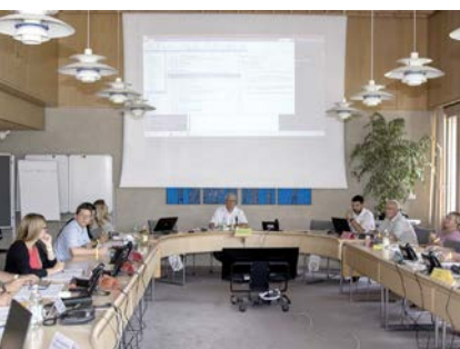
Stabsbesprechung im Verwaltungsstab des Landratsamtes Konstanz am Übungstag 26.06.2017