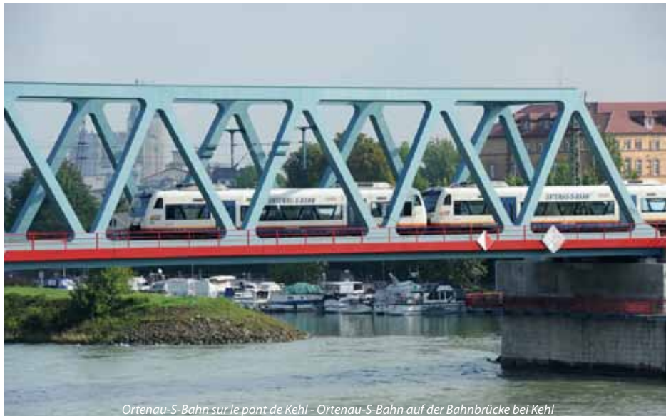
Ortenau-S-Bahn sur le pont de Kehl - Ortenau-S-Bahn auf der Bahnbrücke bei Kehl

Un problème particulier se pose au niveau des transports ferroviaires locaux de passagers : les équipements de sécurité