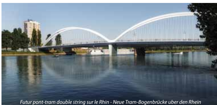
Futur pont-tram double string sur le Rhin - Neue Tram-Bogenbrücke über den Rhein ©Arcadis

Dieses Raumplanungsprojekt ist Teil eines umfangreichen städtebaulichen