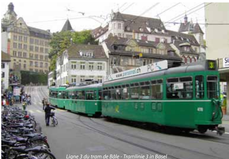
Ligne 3 du tram de Bâle - Tramlinie 3 in Basel

en Allemagne sera inauguré le 14 décembre 2014 ; l'extension de la ligne 3 du tram sur le territoire français jusqu'à la sortie Ouest de la gare de Saint-Louis devrait être achevée d'ici la fin de l'année 2017. La ligne 3 permettra de relier tous les quarts d'heure la gare de Saint-Louis, importante plate-forme inter et multimodale, mais aussi de desservir les sites importants dans les quartiers de Bâle Nord et de Saint-Louis.