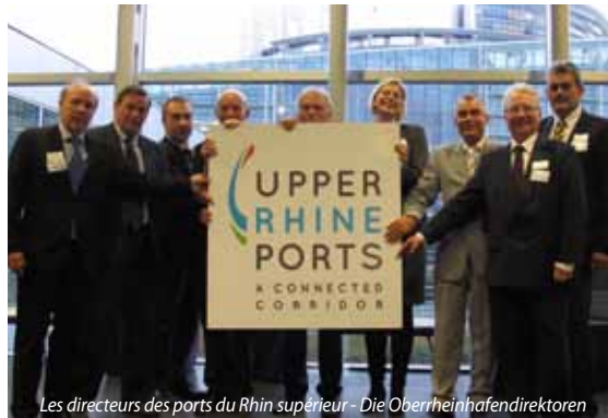
Les directeurs des ports du Rhin supérieur - Die Oberrheinhafendirektoren