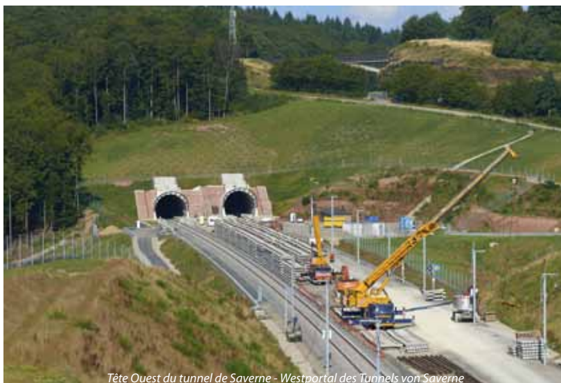
Tête Ouest du tunnel de Saverne - Westportal des Tunnels von Saverne © RFF / L'Europe vue du ciel

Michel JONAS, DREAL Alsace, Service Transport