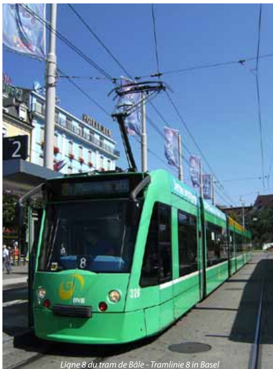
Ligne 8 du tram de Bâle - Tramlinie 8 in Basel

Beide Projekte profitieren neben einer starken regionalen Finanzierung auch von Zuschüssen der Eidgenossenschaft im Rahmen des Agglomerationsprogramms Basel, das