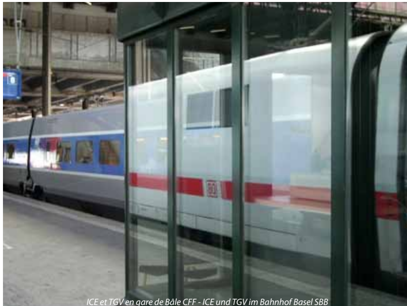
ICE et TGV en gare de Bâle CFF - ICE und TGV im Bahnhof Basel SBB

Intensiv hat sich der Ausschuss damit befasst, wie trotz der Vielzahl der Akteure eine gute Vernetzung von grenzüber-