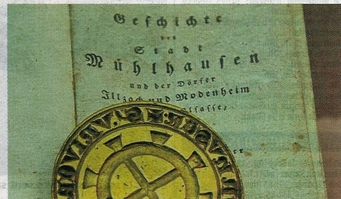
Une reproduction du sceau de Mulhouse (le vrai est à découvrir au musée historique) sera la clef de l'énigme.