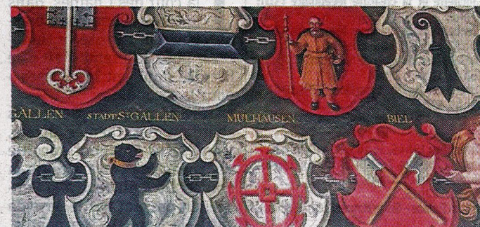
Les blasons de Mulhouse et des treize cantons suisses sont visibles à l'hôtel de ville.